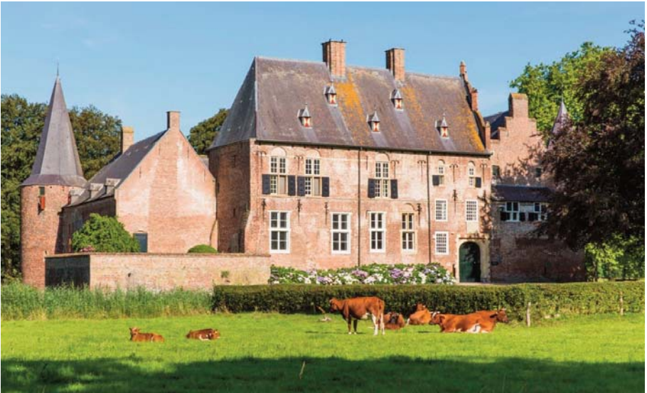
Kasteel Hernen

De Wijenburg in Echteld en kasteel Hernen hebben een rijke historie. De geschiedenis van deze sterk met elkaar verbonden kastelen en hun bewoners is heel boeiend. Beide kastelen zijn ontstaan rond 1200 en kregen rond 1550 hun huidige vorm door de familie Van Wijhe. Van 1271 tot 1751 (dus bijna 500 jaar!) is de Wijenburg in het bezit geweest van de familie Van Wijhe van Echteld. Uit de familie Van Wijhe van Echteld ontstond rond 1400 de Hernense Van Wijhe tak die kasteel Hernen ruim 200 jaar in bezit had.